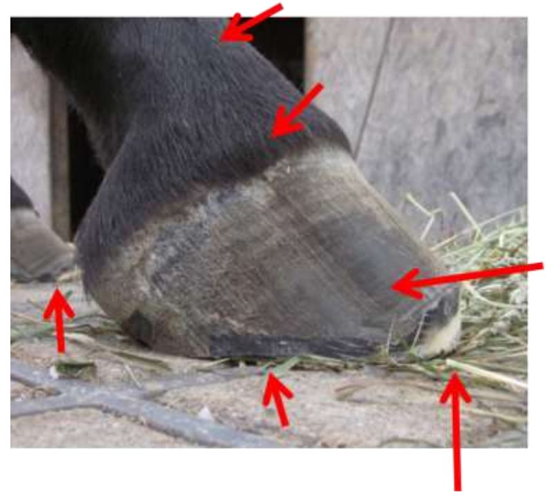
September 2012 Der selbe Huf VR

Selbst-Heilung bei chronischer Hufrehe bei franz. Traberstute Aus meiner Euch bekannten Fallstudie