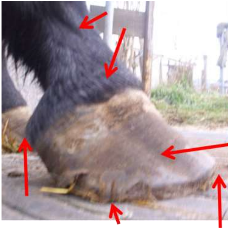
30.01.2012 Vor Start am Beispiel VR