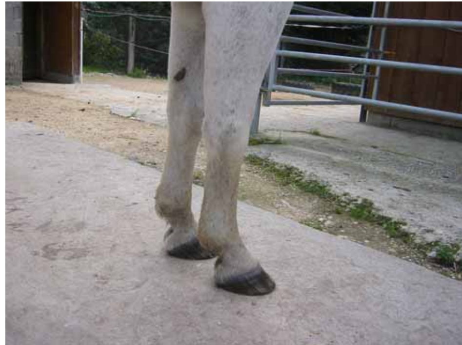
2010 Immer noch sehr lebendig und gesund