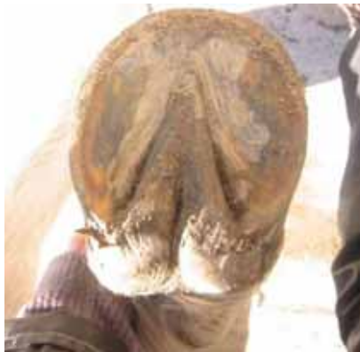
nach 4 Jahren Schweiz noch Gummimatten im Auslauf