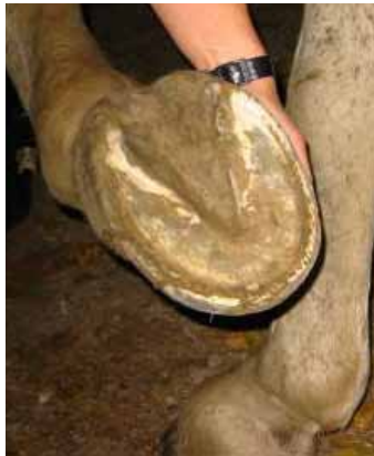
Nach 6 Jahren weicher Untergrund – Rheinwiese