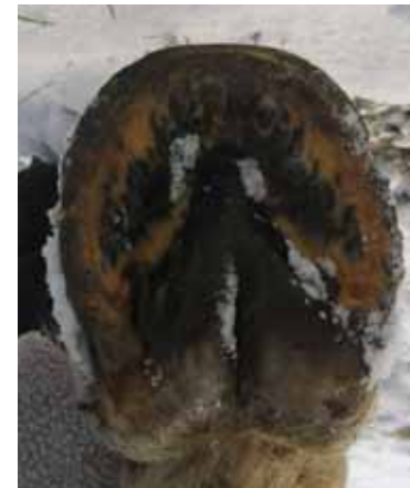
aktuell hinter Huf